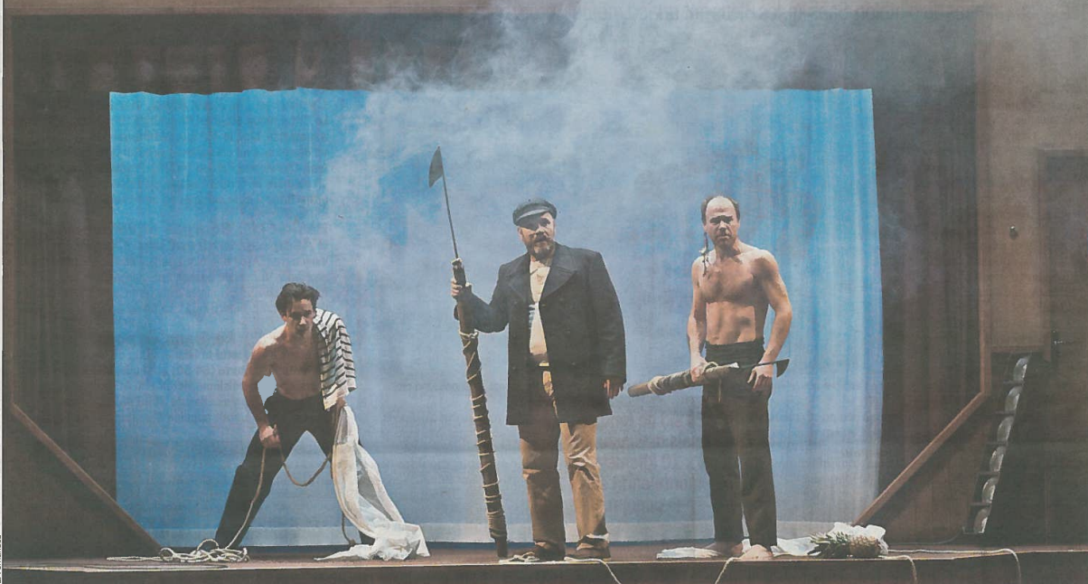
Moby Dick est adapté avec finesse par Fabrice Melquiot qui fait de la baleine blanche une figure féminine fascinante. Le jeu des acteurs, inspiré autant du théâtre que du cinéma, est très séduisant.

Grand favori de la soirée, Stromae (blentôt vingt-neuf ans), le Belge longiligne, a triomphé en remportant trois trophées lors des Victoires de la musique, samedi à Paris : celle de l'artiste masculin de l'année, celle de l'album de chansons pour Rache carrée et celle du vidéoclip pour Formidable .